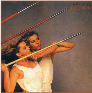
Roxy Music «Flesh and Blood» 10 trk.

Альбом «Flesh and Blood» записан в 80-м году. Группа удивительным образом сумела сохранить свой стиль коллектива «печальных дон-жуанов» и вместе с тем сделать звучание тонким. Парадоксально, но два последних альбома в истории группы в определенном смысле замкнули круг. Первые два выделялись благодаря манерности Брайана Ферри (Bryan Ferry) и экспериментам Брайана Ино (Brian Ino), который любил превращать безобидный звук рок-н-рольной группы в зловещие шумы, создававшие контраст лиризму Ферри. Однако «Flesh and Blood» и «Avalon» являют новаторство Roxy Music в жанре поп-музыки.