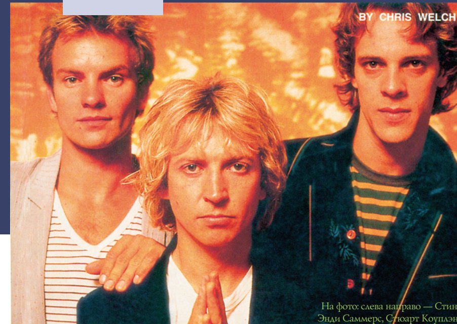
На фото: слева направо — Стинг, Энди Саммерс, Стюарт Коуплэнд