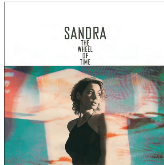
Sandra «The Wheel Of Time» Virgin Schallplatten GmbH & Co. KG 11 trk. 44:55

Настроение альбома полностью соответствует атмосфере поздних 80-х — ранних 90-х. Такой эффект создавался осознанно. Альбом Сандры «The Wheel Of Time» займет свое место в коллекциях меломанов, ценящих романтическое настроение десятилетней давности.