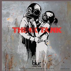
Blur «Think Tank» EMI 13 trk. 49:15