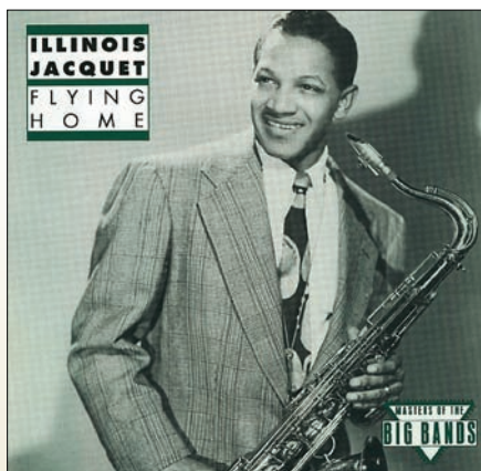
ILLINOIS JACQUET FLYING HOME

И, наконец, квинтэссенция ансамбля Милта Джексона — уникальный тенор-саксофонист Лаки Томпсон (Lucky Thompson) — величайший стилист джаза, музыкант отточенной формы, обладающий узнаваемым теплым саундом.