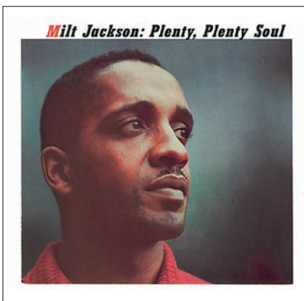
Milt Jackson: Plenty, Plenty Soul