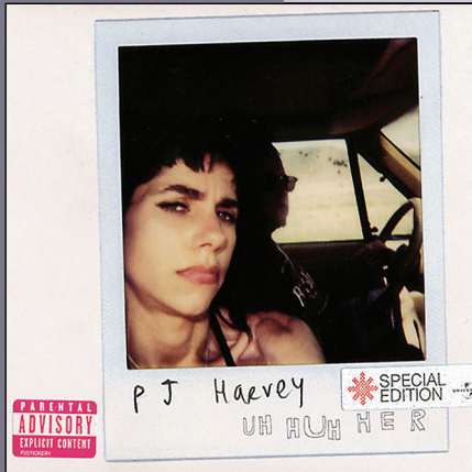
Universal Island, 2004 14 трк., 41:16