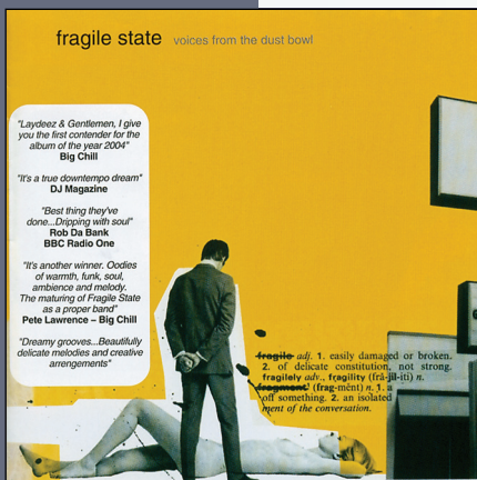
Bar de Lune, 2004 11 trk., 62:19