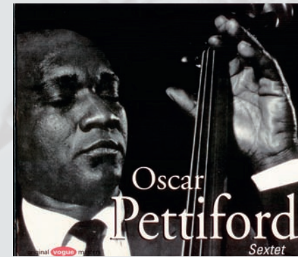
93. OSCAR PETTIFORD SEXTET BMG CLASSICS 40945 VOGUE RECORDS

Джимми — органист, Уилли играл на альт-саксофоне. «The Lion» «Лев» Смит (William Henry Joseph Berthol Bonaparte Bertholoff), укрощая рояль, приводил в восторг самого Дюка Эллингтона. Была еще «императрица блюзов» Бесси Смит... И скрипач-виртуоз свинга Стафф Смит. Но послушаем, однако, редкостные записи незаслуженно забытого тенор-саксофониста Таба Смита! Вот его альбом фирмы Delmark. Ну, как?.. Не только Хокинсом и Уэбстером крепко джаз, не так ли?..»