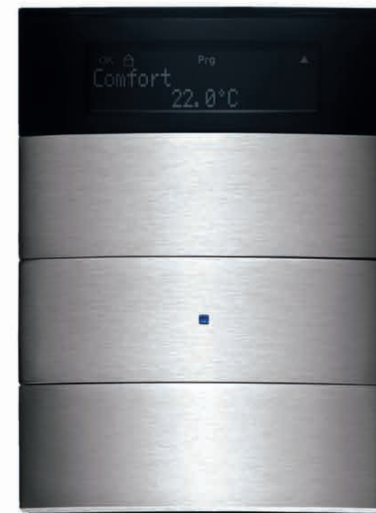
Клавишный сенсор Berker V.IQ, 3-канальный, с дисплеем, исполнение из нержавеющей стали.

В.IQ – ИНТЕЛЛЕКТУАЛЬНЫЕ ДОМА СОВЕРШЕННО ПРОСТОЕ УПРАВЛЕНИЕ