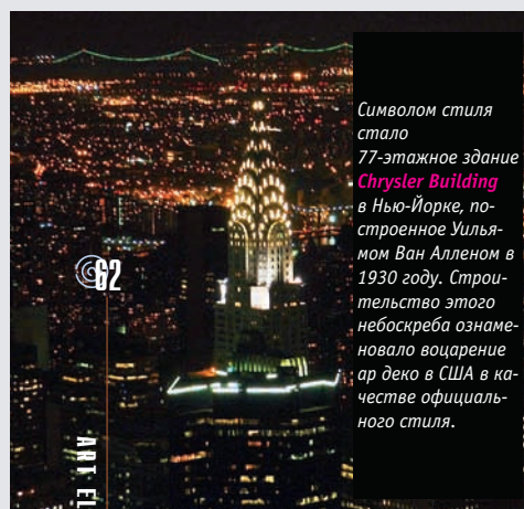
Символом стиля стало 77-этажное здание Chrysler Building в Нью-Йорке, построенное Уильямом Ван Алленом в 1930 году. Строительство этого небоскреба ознаменовало воцарение ар деко в США в качестве официального стиля.