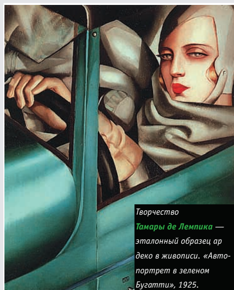
Творчество Тамары де Лемпика — эталонный образец ар деко в живописи. «Автопортрет в зеленом Бугатти», 1925.

В краткую эпоху подъема и эйфории, охвативших Америку и Европу 1920-1930-х годов расцвел «последний большой стиль» в искусстве XX века — роскошный ар деко. Величественность и серьезность, скупость линий и практическое удобство сделали ар деко воплощением буржуазных представлений о качестве жизни.