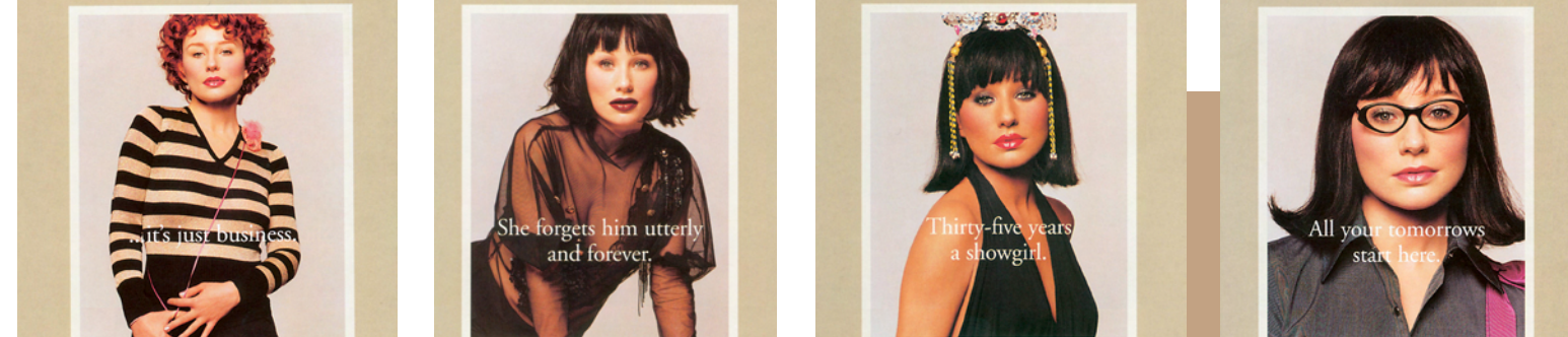
Tori Amos «Strange Little Girls» Atlantic 12 trk. 62:09