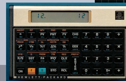
Культовый финансовый калькулятор Hewlett-Packard 12C

Современный терминал для прямого электронного доступа к торговым площадкам через интернет — платформа CyberTrader Pro ([RTF bookmark start: OLE_LINK2]cyber.[RTF bookmark end: OLE_LINK2].gif)